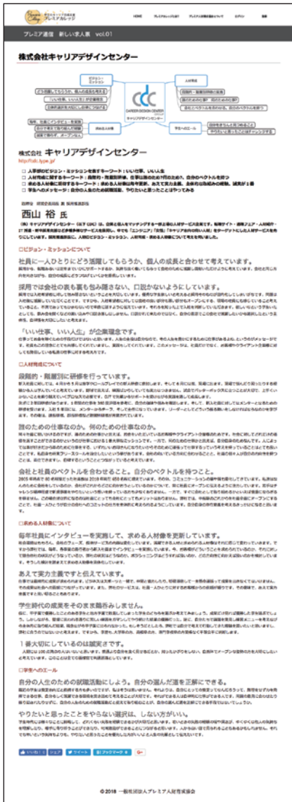
プレミア通信 人事部長インタビュー vol.01

協会の設立主旨や活動内容、教育イベント、発行物等にご賛同、ご協賛いただけますことを願っています。